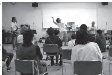
パパ's絵本プロジェクトの絵本ライブ (江府町)