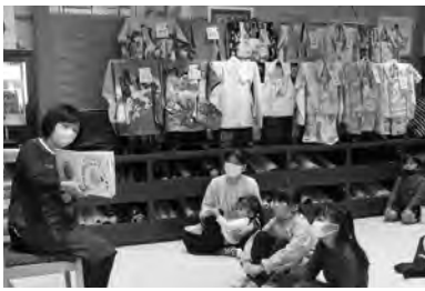
和服専門店出張おはなし会 (袋井市)