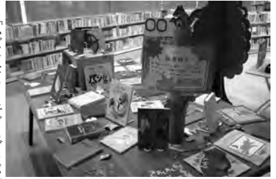
特展展示「読書の秋〜まちやまで紅葉狩り〜」(三条市)