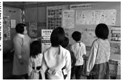
「図書館の達人教室」で学ぶ(土庄町)