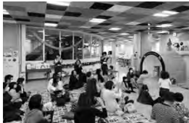
読書週間ハロウィンおたのしみ会 (滑川市)