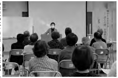
大野市読書大会 講演会 (大野市)