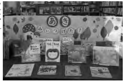
展示「あき、みつけた」(四国中央市)