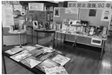
読書週間図書展示「宮沢賢治没後90年」(青森市)