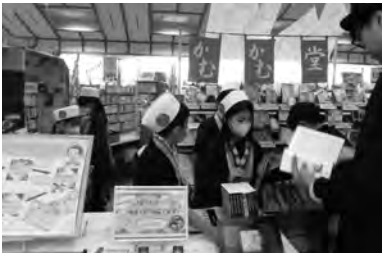
子ども読書クラブによるクイズラリー (甲州市)