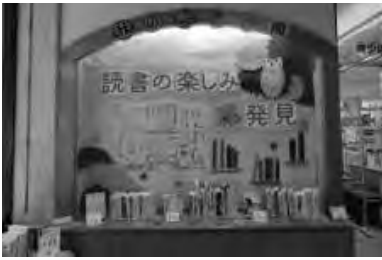
職員のおすすめ本を分類ごとに展示 (石垣市)