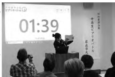
中高生ピリオオバトル(岩出市)