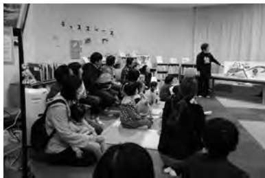
ナイトライブラリーでおはなし会を開催 (会津坂下町)

●茨城県立図書館 ●「アフタヌーン美術講座」共催 茨城県陶芸美術館 講師 学会員 ●「ライブラリーシアター」禁じられた遊び」 ●「カフェのしらべ」東京藝術大学卒業生によるオーボエ演奏の演奏 ●「いばらき読書フェスティバル 2023」共催 県教育委員会、茨城県読書推進運動協議会、茨城県図書館協会、茨城県教育研究会、茨城県図書館研究部、茨城県高等学校教育研究会、茨城県立図書館ボランティア協議会、茨城県立図書館団体等感謝状、「読書感想文コンクール」(読書感想文朗読、全国大会)、オパール2023」茨城決戦大会」 ●「キヤラリー」展示・イベントゲームでSDGsを学ぼう」茨城の魅力発見!!「まのけんし」クイズラリー」「ポード」であそぼう」本の修理マイスターになろう」「婚活必勝法」図