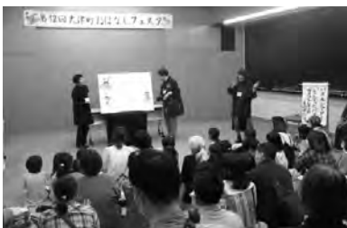
ボランティアによるパネルシアター (大津町)