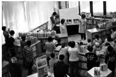
図書館まつりで絵本の読み聞かせ(小美玉市)