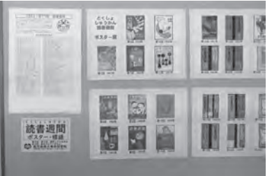
「読書週間」の歴代ポスターと標語を展示 (県立)

関する図書の展示 ②「鉄道絵本の読み聞かせ会」協力「ジュンク堂書店、HONOSATO LOCOMOCORO」(乗りものアートユニット) ●鹿兒島市城西公民館図書室 ●テーマ本の展示「ハロウィン」遺言に関する本「秋に関する本」など ●読書週間ポスターの掲示 ●鹿兒島市谷山市民会館図書室 ●テーマ図書展示「読書がスポーツに出来る事」「行業の秋」「人権とは」「はたらくってどんなこと」「ハロウィン」など ●読書週間ポスターの掲示 ●「谷山市民会館だより」に読書週間標語を掲載 ●鹿兒島市吉野公民館図書室 ●「読んであげたい絵本展」①読書週間ポスターの掲示 ②鹿兒島市立図書館発行の絵本ガイド「読んであげたい絵本」図書館のおすすめ(00冊)「4・5・6歳児向け」掲載図書の展示 ③季節の図書展示「ハロウィンや秋」など、迷路探し絵本の展示 ④「白筆証書遺書」書庫保存制度強化月間 ●鹿兒島市伊敷公民館図書室 ●読書週間ポスターの掲示 ●テーマ図書展示 利用者の推薦図書と紹介カード、遺言の日関連図書、「hotな読書会」で紹介した図書 ●「伊敷ビブリオバトル」対象「13歳以上