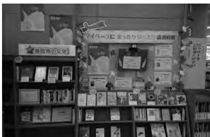
〔左〕テーマ展示「マイペースにまったりゆったり読書時間」(鳥取県倉吉市) 〔右〕「図書館まつり2023」でおはなしの会を開催(長野県下諏訪市)

〔上記の数字は、各道府県読書協会の報告をもとに、編集部での整理方法によって作成〕