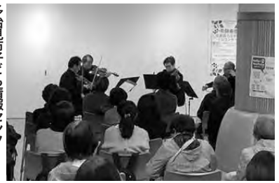
飛騨春慶弦楽器カルテット ミニコンサート (高山市)