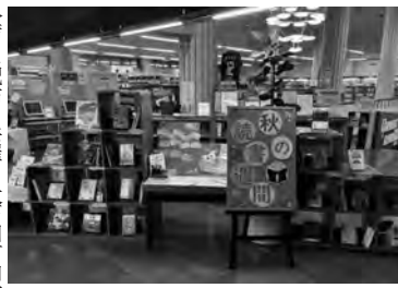
「こころとあたまの、深呼吸。」がテーマの特集コーナー (山形市)