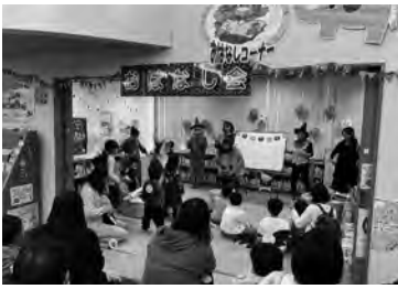
仮装した子どもたちもハロウィンおはなし会に参加 (市貝町)

●「映画会」①「マイメロディの赤ずきん」と「キキとララの青い鳥」対象「子ども」②「モリにいる場所」対象「一般」 ●「千手町立図書館」 ●「クロスワードパズルに挑戦！」 ●「五味太郎「ぼくはふね」パネル展」 ●「ドキドキ図書館ツアー」対象「幼稚園・保育園の年長児」 ●「令和7年度キラリと光る読書のまち野木コンクール」絵画・感想文・俳句のコンクール ●「推薦図書に見出しをそえて展示」 ●「リアイクル市」 ●「図書館まつり」おはなし会、フェルトのしおりづくり、図書館探検、工作教室、パズル、ピアノとフルートの演奏、ミニライブ、ピアノオバトル 協力「ボランティア」 ●「大人の読書月間」本を借りるとスタンプが2倍に ●「高根沢町図書館 全館」 ●「みんなのイチ推し紹介します」推薦図書を紹介 ●「絵本つたのしい」絵本の読み聞かせ、紙芝居、簡単な工作など 対象「幼児・児童」 ●「絵本と自然を楽しむ会」対象「一般」会場「那須平成の森フィールドセンター」