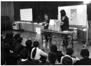
小学校で出前おはなし会 (上市町)