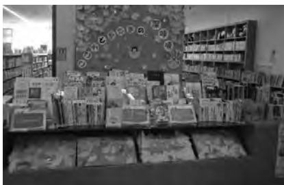
〔左〕特集展示「こころとあたまの、深呼吸。」(愛媛県松山市)