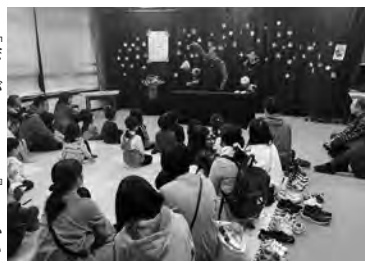
「子どものためのおはなし会」を開催(草津市)