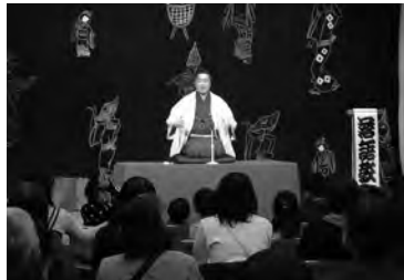
絵本ライブ「THE 子どもも寄席」(羽後町)

舟形町中央公民館図書室 ●「令和7年度 舟形町絵本作家読み聞かせ講演会」講師Ⅱ広瀬克也(絵本作家) 主催Ⅱ舟形町読み聞かせ協議会 共催Ⅱ町教育委員会