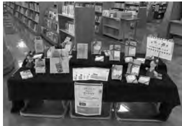
本と本を交換する「ブラインド・ブック・マーケット」(三朝町)