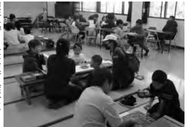
体験型イベント「ボードゲームであそぼう」(八代市)