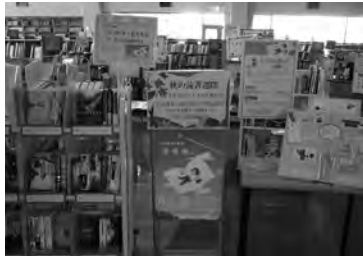
さまざまな秋の読書週間事業を実施(新地町)