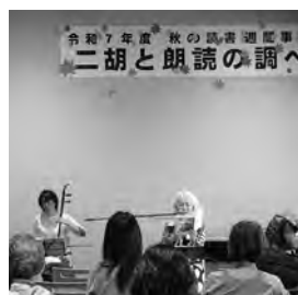
〔右〕令和7年度 秋の読書週間事業「二胡と朗読の調べ」(北海道津別町)