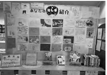
「あなたの推し本紹介」POP 作品を展示 (浦添市)

●「秋のブックフェア」シアタにおける読書のススメ、〇〇の秋「ミステリーを読む」テーマ別に選書して紹介 ●「秋の読書週間」①パネル展「実践!いきいき健康ライブ」市健康推進計画の紹介、健康に関する資料の展示 ②貸出冊数制限の拡大 ●「西原町立図書館」 ●「フスタルジーに浸ってみませんか?」①昭和・平成世代が懐かしく感じる資料、子ども遊びに関する資料の展示 ②「あなたの思い出掲示板」利用者より子ども時代の思い出を募集、掲示 ●「西原町立図書館」ときどき館長代理さわりんの「オスメの1冊」インタビュー展」西原町に来たスポーツ選手へのインタビューの要約 ●「第14回ブックフェスタ」喜楽星の「たまで箱」読み聞かせ(大形絵本、エプロン・パネルシアター)手作り体験ストラップ、破れた本の修繕クリニックほか、共催||読みあいネットワーク喜楽星 ●「もも文化交流センター図書資料室(本部)」 ●「本を借りてガチャを回そう」 ●「このころとあたまに栄養チャージ」した本を紹介しよう」心に残った本、勉強になった本を利用者より募集、展示 ●「官野座村読書週間」貸出制限冊数の拡大 ●「雑誌リサイクル」貸出時に雑誌付録を進呈 ●「親子で楽しむ民話」紙芝居や語りで沖縄の民話を読み聞かせ、手遊び ●「秋の読書週間」①本・雑誌・紙芝居の貸出制限冊数の拡大 ②「スタップのおすすめ本コーナー」手作りポップとともに展示 ③「このころとあたまの、深呼吸」詩、写真集などの本を展示 ●「本をかりてガチャを回そう!」 ●「YAPOPコンテスト」中高生より図書推薦ポップを募集、展示、「ピアリオバスター」推し本」紹介図書の展示 ●「絵本のひろば&子どもげきしょう」共催||絵本のひろば実行委員 ①落語