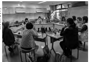
「私のピカイチ本」をテーマに読書会を開催(甘楽町)

●「秋の古本市」 明和町立図書館 ●「読書を楽しんでみませんか」本を5冊借りると手作りのしおりを進呈 ●「ウィークス大泉町図書館」 ●「図書館クイズラリー」クイズのヒントを館内各所に設置、正解者に景品を進呈