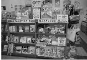
特集コーナー「おすすめします! この1冊!」(玄海町)

●「おはなしとどけ隊」会場「遠隔地の小学校」 ●「小城市民図書館 小城市」 ●「えいごのおはなし会」アメリカ人講師による英語のおはなし、読み聞かせ「ブックリサイクル」 ●「図書館講座」小城市の歴史をみてみよう」 ●「展示 読書週間」司書の推薦図書 ●「読書週間」 ●「展示 読書週間」司書の推薦図書 品進呈 ●「秋の読書週間」 ●「読書エッセイ」図書館や本、読書に関するエッセイを募集 ●「図書館deコンサート」(2日)演奏「近隣学校児童楽団」 ●「図書館deヨガ」講座「簡単なヨガを講師が紹介、関連本の展示も」 ●「手作りランプシェード講座」ミニおはなし会付き ●「図書室クイズ大会」(ひとり)で頑張るコース「ファミリーコース」を用意、結果に応じて景品進呈 ●「よしみ読書講座」利用者の考えた読書標語をしおりにて図書室、学校で配布 ●「無料ブックリサイクル」(2日) ●「雑読りサイクル市」