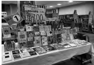
秋の読書週間期間展示「プレイバック昭和100年」(八戸市)

●「企画展示」図書館でナゾトキ!キーワードを全部集めると「謎解き認定カード」を進呈、関連図書の展示も ●「りんご(児童関与型)」関連児童書を展示 青森市民図書館 ●「読書週間図書展示」関連図書の展示貸出 ①「気になる本」シリーズ