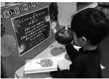
「としよかん魔女からの挑戦状!」にチャレンジ(燕市)