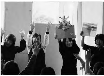
全国で活躍する絵本専門士によるおはなし会 (松川村)