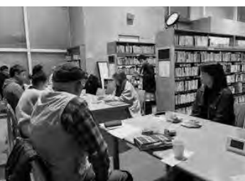
「大人限定 夜の図書館『ココドク』」を開催 (九重町)