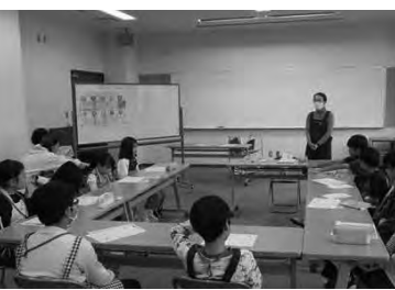
小学生を対象とした「図書館の達人教室」(土庄町)

学生が作ったポップをつけて展示貸出ライブラリーをたつ(宇多野町) 絵本読み聞かせとわらわらしたのぼり(宇多野町) グループおはなし(宇多野町)