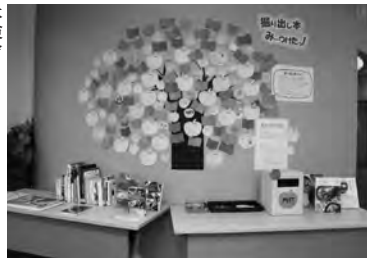
展示「掘り出し本、み一つけたっ!」(明石市)