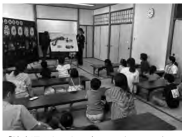
「読書週間おはなし会」でパネルシアター(徳之島町)