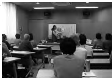
図書館での読み聞かせの意義、在り方を考える講座（日立市）

茨城県立図書館・茨城県読進委員会・茨城県読書推進運動協議会・茨城県図書館協会・茨城県教育委員会・茨城県図書館研究部・茨城県高等学校教育研究会図書館部・茨城県読書会・茨城県立図書館・水戸生涯学習センター ●「いばらき読書フェスティバル2025」 協力：BOOK MEETS ZEN ①「表彰式」読書団体等感謝状贈呈、県読書感想文コンクール入賞者表彰、県読書感想文受賞者朗読 ②全国大会へ ③講演会「オモロイ純文運動」 ④「山行」執筆ワークショップ ⑤「水戸三蔵」 ⑥「バルーンアート」を楽しくしよう ⑦「あなただけのオリジナル」お作り ⑧「読解」図書館へ消えた一冊を探せ ⑨「しかけえほん」ふれてみよう ⑩「レコードをきいてみよう」知られざる図書館の資料を見てみよう ⑪本の修理を試してみよう ⑫県内関係団体による出店 ⑬茨城県郷土文化研究会な