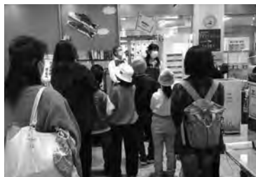
図書館まつりで書庫見学ツアーを開催 (加須市)