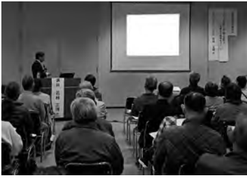
読書週間記念講演会「伏見と宇治を結ぶ〜水運から電車まで〜」(宇治市)