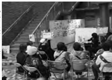
「秋のおはなし会」で絵本の読み聞かせ(紀美野町)