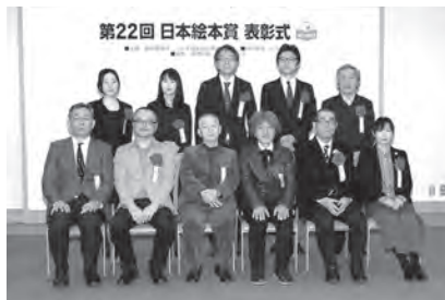
日本絵本賞受賞者がそろって記念撮影