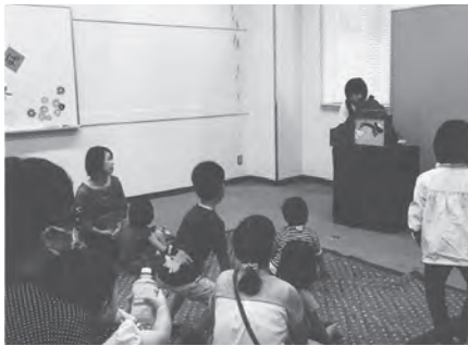
地域のいろいろな施設で会場にあつたおはなし会

昨年度の私たちの活動回数は200回を超えていました。会員一人ひとりが自分にできる活動をしてきた結果です。なかには活動場所が