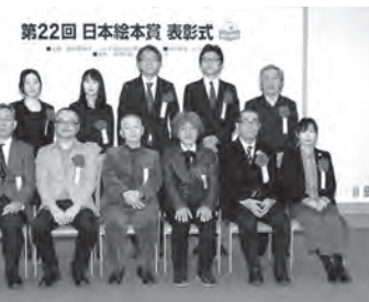
日本絵本賞受賞者がそろって記念撮影