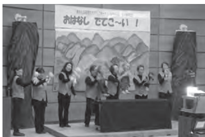
かやのみ会のトレードマーク、おそろいのベストで、30周年記念公演に臨みました

私たちにとつての30年は、ひとつのきっかけです。さて、これから次は何をしようか、どんなおはなしをしようか、どんな作品を作ろうかな、とウキウキしているのが本音です。