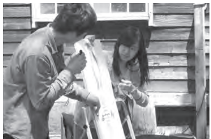
かやのみ会のアドバイスを受けた学生たちがおはなし会で活躍!