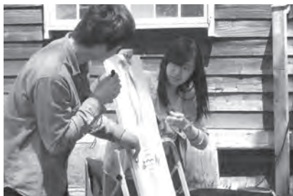
かやのみ会のアドバイスを受けた学生たちがおはなし会で活躍!

参加。人々の暮らしに息づいた空間のなかでの「本活」プロジェクトです。ベンチいっぱいのお客さまを前にした「おはなし会」、紙芝居では「ワニの役」「歯医者さんの役」と、学生たちが大活躍。青空の下で季節の風を感じる一日となりました。