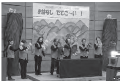
かやのみ会のトレードマーク、おそろいのベストで、30周年記念公演に臨みました

私たちにとつての30年は、ひとつのきつかけです。さて、これから次は何をしようか、どんなおはなしをしようか、どんな作品を作ろうかな、とウキウキしているのが本音です。