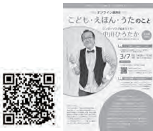
NPOブックスタートホームページ QRコードと講演会チラシ

また、講演会はライブ配信終了後、3月31日(水)までNPOブックスタートのYouTubeチャンネルで視聴が可能。 ●NPOブックスタート ホームページ https://www.bookstart.or.jp/