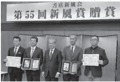
受賞者の出版社代表と編集者と 新風会 大垣会長の記念写真

『ぼくはイエローでホワイトで、 ちよつとブルー』は、イギリスで 暮らす著者が、地元の「元底辺中