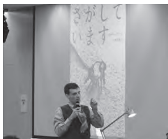
オンライン講演会などを予定しています (写真は2016年の講演会の模様)

5月3日〜5日に、「上野の森親 子ブックフェスタ」を冠したオン ラインイベントとして形を変えて 実施することいたしました。 準備が整いしだい、ご案内をい たしますのでどうぞお楽しみに。