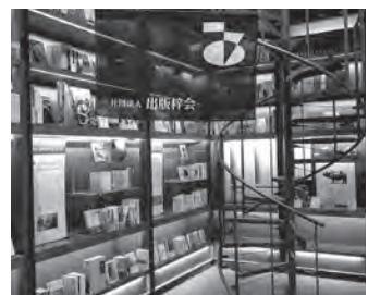
展示会「危機を越え 未来を目指すため に今できること」で受賞社を紹介中

しかしながら緊急事態宣言の発 出を受けて検討した結果、新型コ ロナウイルス感染症の収束が未だ 見通せないことから、やむを得ず 中止を決定いたしました。本と読 者の楽しい出合いの場を失ってし まうことは、主催者はじめ関係者 一同、たいへん残念な思いです。 なお、企画していた講演会など のイベントにつきましては、同じ