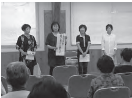
活動の対象は幼児から高齢者までと幅広い

年3回の図書館朗読会や、年2回の市内の朗読グループとともに開催する朗読会への参加のほか、地域のサロン、施設、小学校での出前朗読会などを実施しています。高齢者、幼児、小学生とさまざまな年齢の方々に、聴いていただくことよって、私たちが勉強をさせていただき、また元気もも