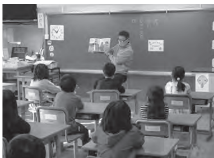
子どもたちには本を、大人たちには学校を知ってもらいたい

「どくしよ」部としては、少人数の決まったボランティアだけで読み聞かせをするよりも、より多くの人に参加してもらいたいと考えています。多くの地域の人が学校