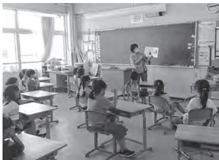
19年続いています！ 学校での読み聞かせは

最後になりましたが、心よく受け入れてくれる先生方、いつもしっかり聞いてくれる子どもたち、活動を後押ししてくれる図書館、そして、いままでいろいろな活動に協力してくれた方々に心から感謝申し上げます。